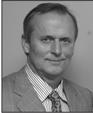
(1983-1990) John Grisham

ဂျွန်ခရစ်ရှမ်းကို ၁၉၅၅ ခုနှစ်၊ ဖေဖော်ဝါရီလ ၈ ရက်နေ့တွင် အမေရိကန်နိုင်ငံ၊ အာကန်ဆောပြည်နယ်၌ မွေးဖွားခဲ့သည်။ ဥပဒေဘွဲ့ရ ရှေ့နေအဖြစ်နှင့် မစ္စစ္စဝီပြည်နယ်၊ ဒီမိုကရက်တစ်ပါတီဝင် လွှတ်တော်အမတ် (၁၉၈၃-၁၉၉၀) ဖြစ်လာခဲ့ရာမှ စာရေးဆရာ ဖြစ်လာသူ။ သူ ရေးခဲ့သည့် စာအုပ်ပေါင်း ၃၇ အုပ် ရှိပြီ။ ရောင်းအကောင်းဆုံး စာရင်းဝင်တွေ ပါပြီး ကမ္ဘာအနှံ့ အုပ်ရေ သန်းပေါင်း ၃၀၀ ရောင်းရသော ဟူ၏။